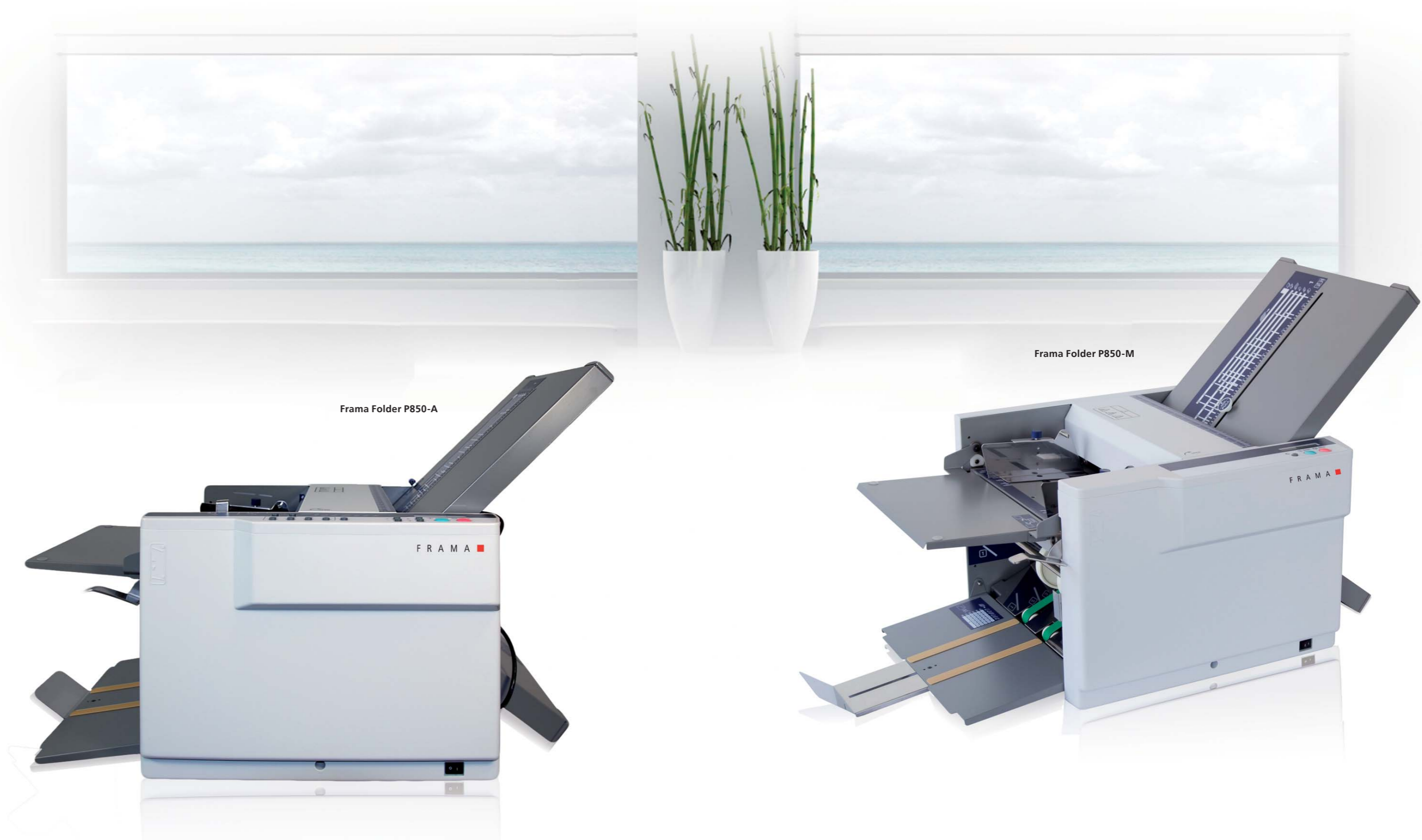
Frama Folder P850-A

Der Papierschatz beider Falzmaschinen verfügt über ein Fassungsvermögen von bis zu 500 Blatt (80g/m²).