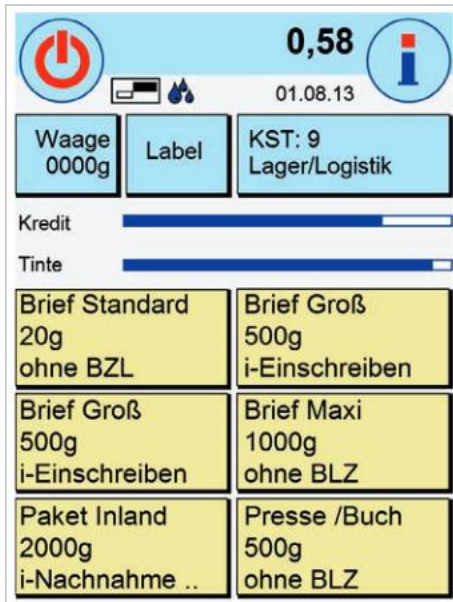
Abbildung in Originalgröße