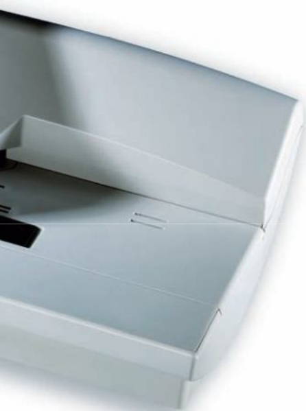
Matrix F42 inkl. Waage und Acrylständer