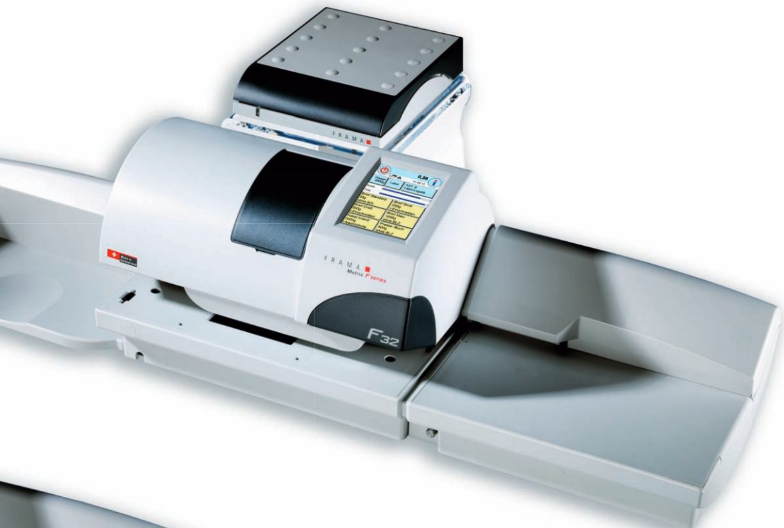
Matrix F32 inkl. Waage und Acrylständer