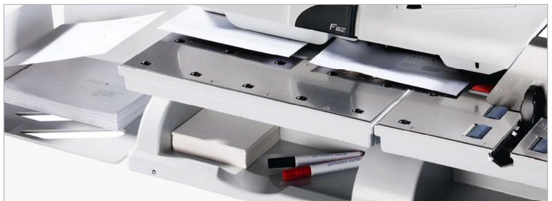
Matrix F82 mit Podest PF (Standard)

Die grosse Auflagefläche der Zuführung in Verbindung mit der überdimensionalen Auffangschale sorgt dafür, dass notwendige Arbeitsschritte auf ein Minimum reduziert werden. Der zur Standardausrüstung gehörende Untersatz PF bietet daneben noch Ablagefächer für Zubehör oder Platz für wichtige Arbeitsmaterialien. Sie haben alles in Reichweite.